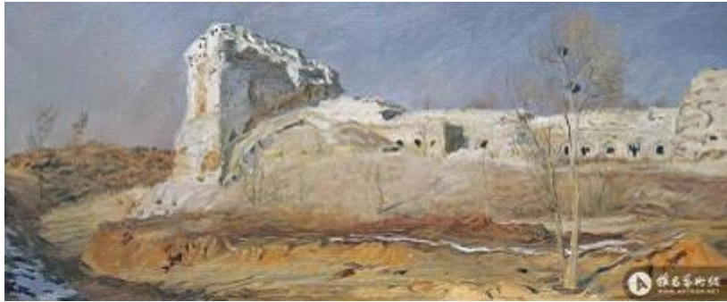
【Welle am Gelben Fluss】 76cm*180cm Ölmalerei 2012