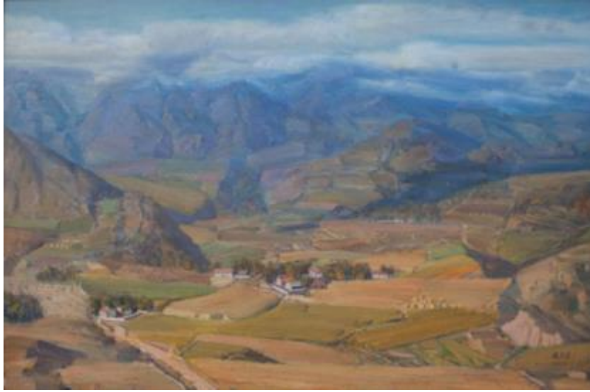
【Frühherbst】 12 0cm*80cm Ölmalerei