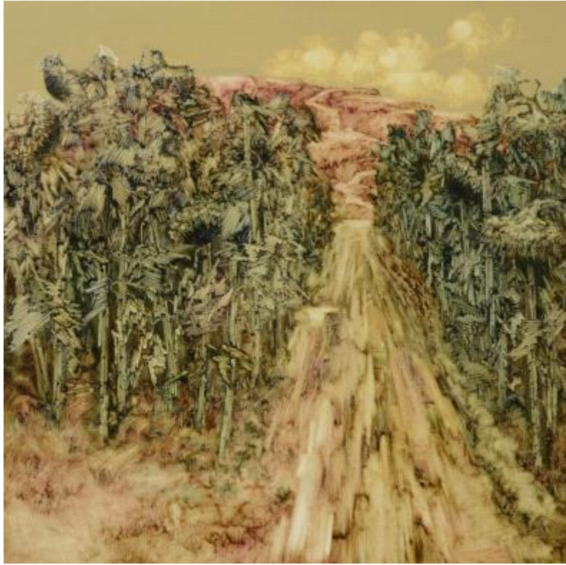
【Meer der Sonnenblumen】 100cm*100cm Ölmalerei