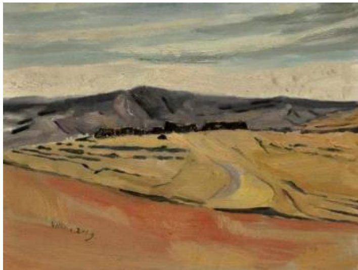
【Nachmittag】 45x60cm Leinen-Ölmalerei 2013