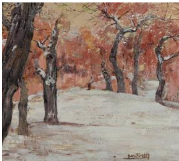
【Warmer Winter】 45cm*45cm Ölmalerie 2011