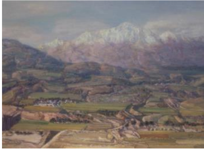
【Am Fuß der Qilian-Berge】 13 0cm*97cm Ölmalerei 2010