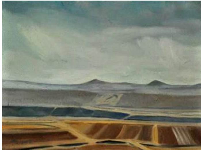
【Erster Frost】 45x60cm Leinen-Ölmalerei 2014