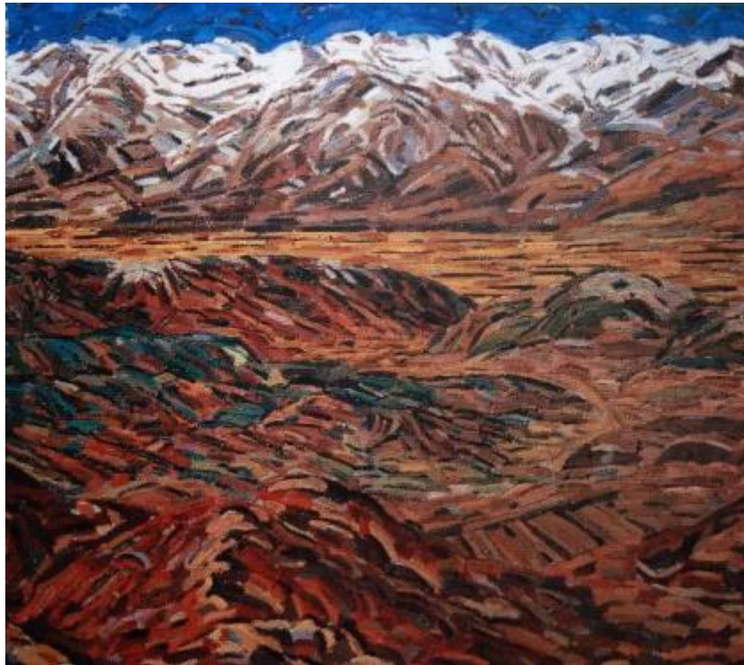
【Wind auf dem Hochland】 160x180cm Leinen-Ölmalerei 2003