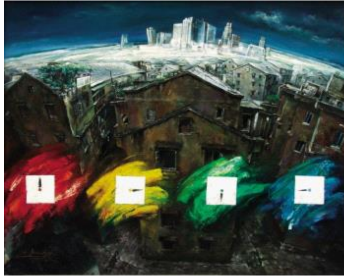
【Jahre】 18 0cm*150cm Ölmalerei