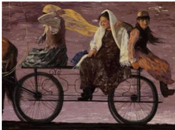
【Wind】 125cm*170cm Ölmalerie 2012