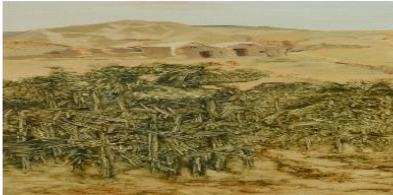
【Meer der Sonnenblumen im Frühherbst -1】 150cm*75cm Ölmalerei (links)