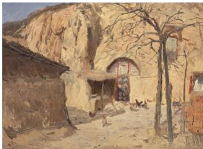
【Warme Wohnhöhle】 100cm*70cm Ölmalerei 2013