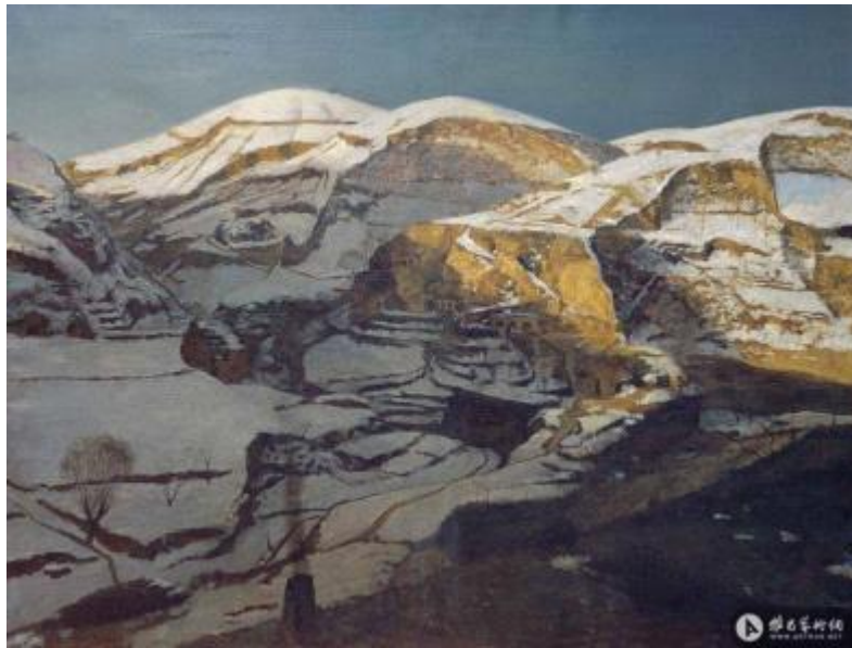
【Dörfer】 89cm*116cm Ölmalerei 1995