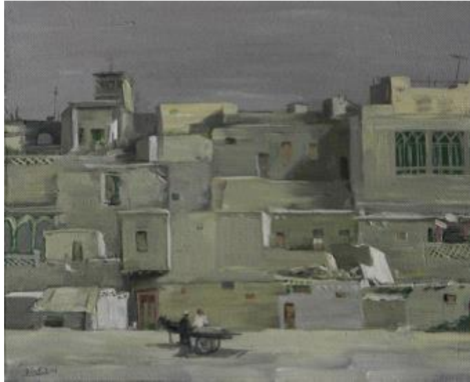
【Kashi Landschaft Serie 1】 50cm*60cm Ölmalerei 2006