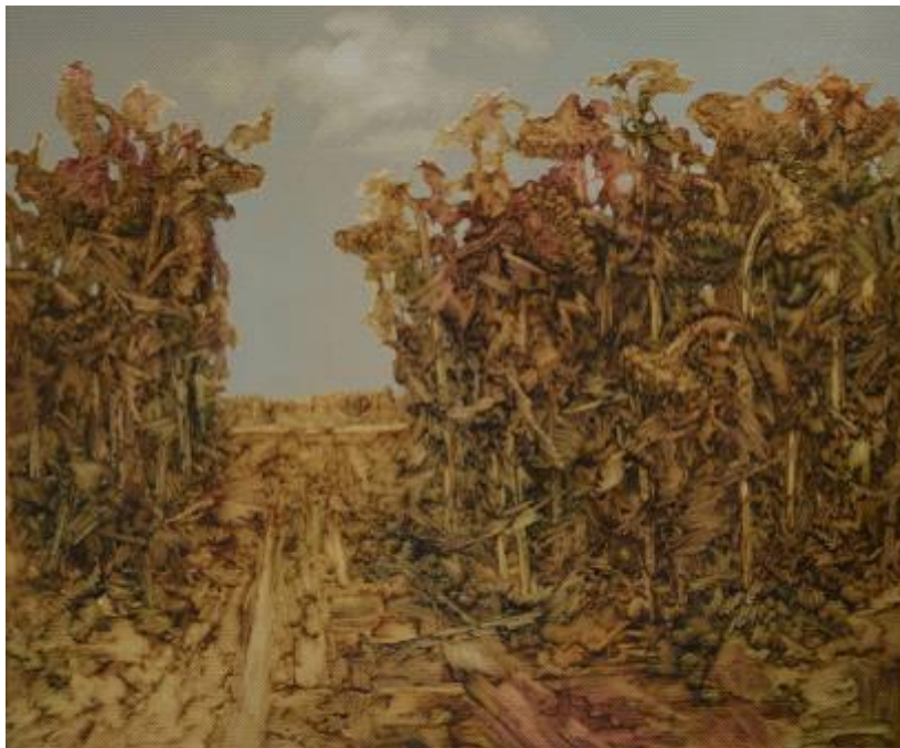
【Wolkenhimmel und Meer der Sonnenblumen】 150cm*180cm Ölmalerie