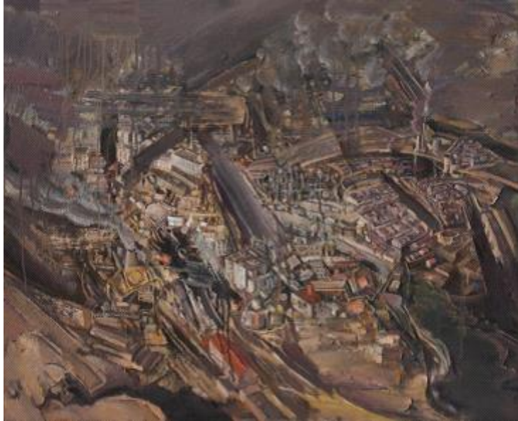
【Die verlorene Landschaft】 13 0cm*97cm Ölmalerei 2014