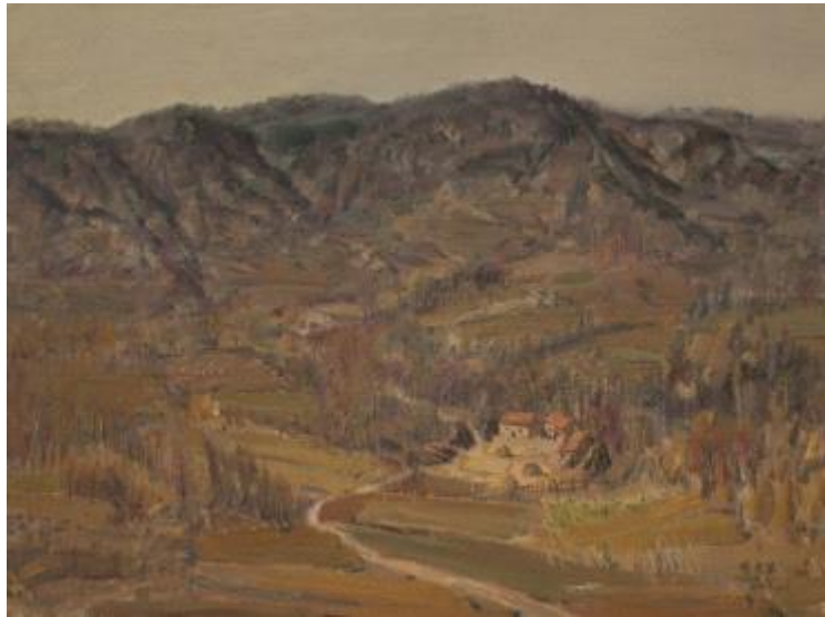
【Familie am Fuß der Berge】 80cm*60cm Ölmalerei 2012