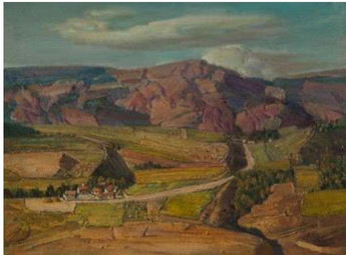
【祁连之秋】 8 0cm*60cm 油画 2010