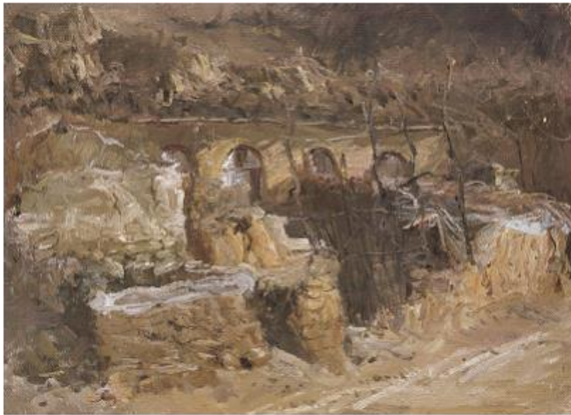
【Hof】 60cm*81cm Ölmalerei 2012