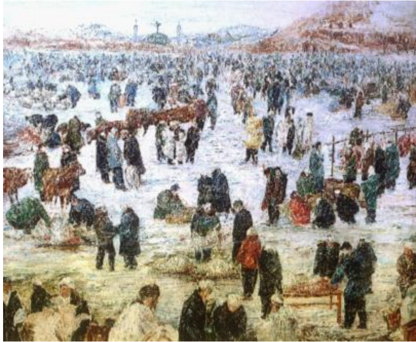
【Glückschnee】 150cm*180cm Ölmalerei