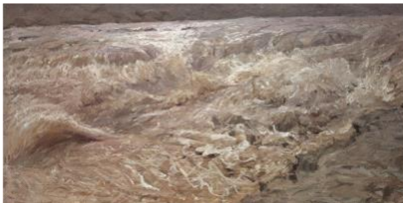
【Welle am Gelben Fluss】 81cm*160cm Ölmalerei 2007