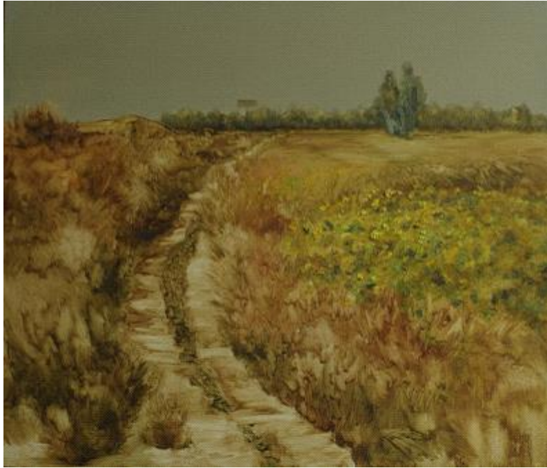
【Herbstgold an der Grenze—Wilde Sonnenblumen】 60cm*70cm Ölmalerie