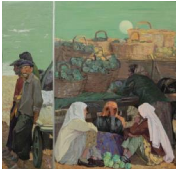
【Erntezeit】 150cm*160cm Ölmalerei 2013

1993, „Schloss“, die Peking Chinas erste Biennale der Malerei.