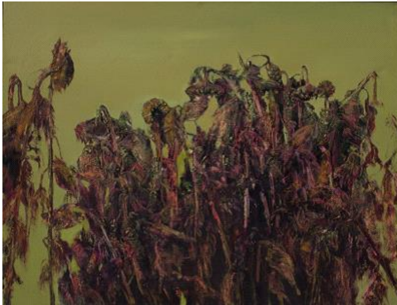
【Sonnenblumen Serien—Sprache aus Herbst】 100cm*130cm Ölmalerei