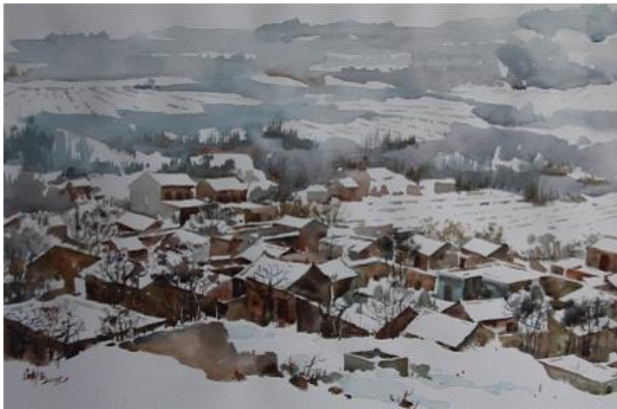
【Dorf im Schnee】 40cm*58cm Aquarell 2008