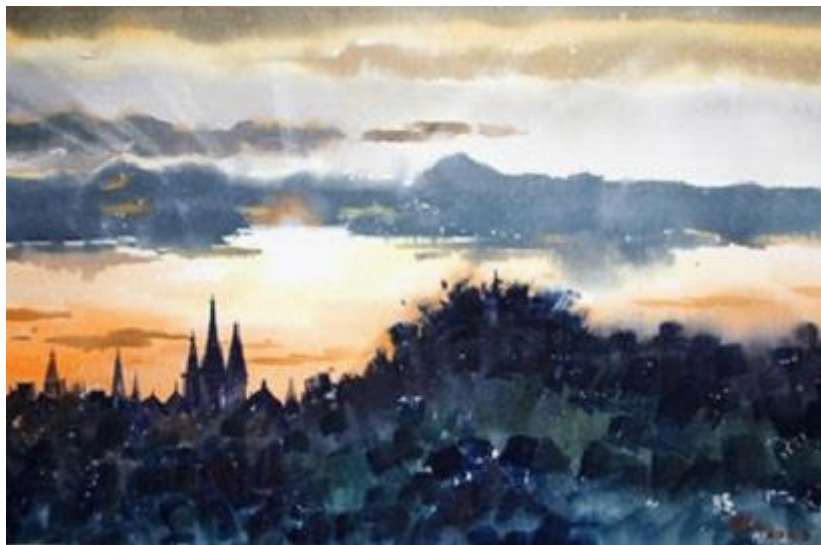
【Impression von Europa 3】 57cm*77cm Aquarell 2011