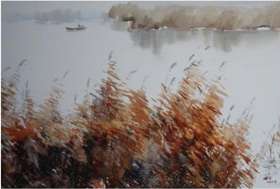
【Stille Betrachtung an Röhricht im Herbst】 67cm*87cm Aquarell 2012