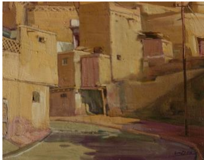
【Kashi Landschaft Serie 6】 40cm*50cm Ölmalerei 2006