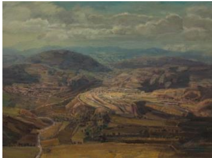
【Rückblick auf Guanzhong】 8 0cm*60cm Ölmalerei 2012