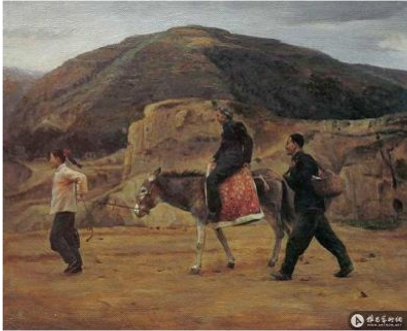
【Esel laufen lassen】 61cm*74cm Ölmalerei 1995