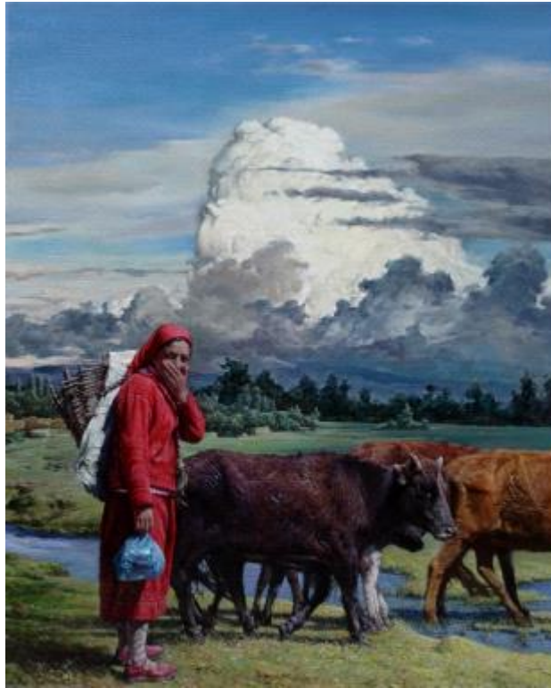
【Zuhause】 162cm*130cm Ölmalerei