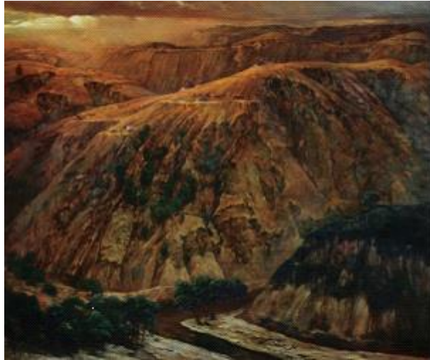
【Plateau im Herbst】 18 0cm*150cm Ölmalerei