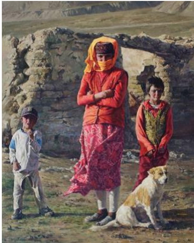
【Abendwind】 162cm*130cm Ölmalerei