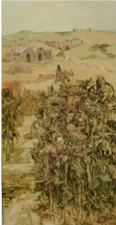
【 Meer der Sonnenblumen im Frühherbst -2】 150cm*75cm Ölmalerei (rechts)