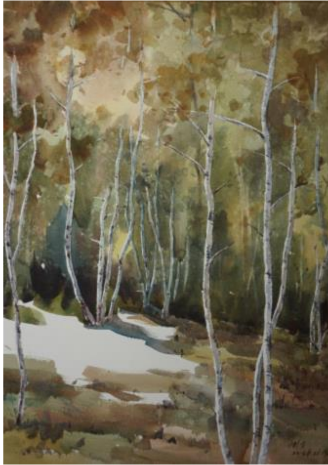
【Wald der Weißen Birken】 57cm*37cm Aquarell 2015