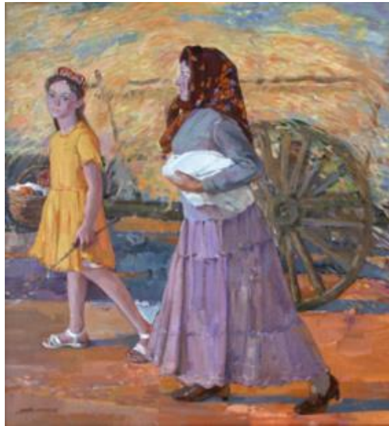
【Heuhaufen】 150cm*160cm Ölmalerie 2006