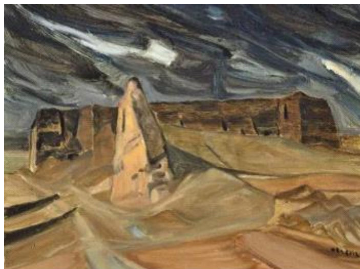
【Burg an der Grenze】 60x80cm Leinen-Ölmalerei 2012