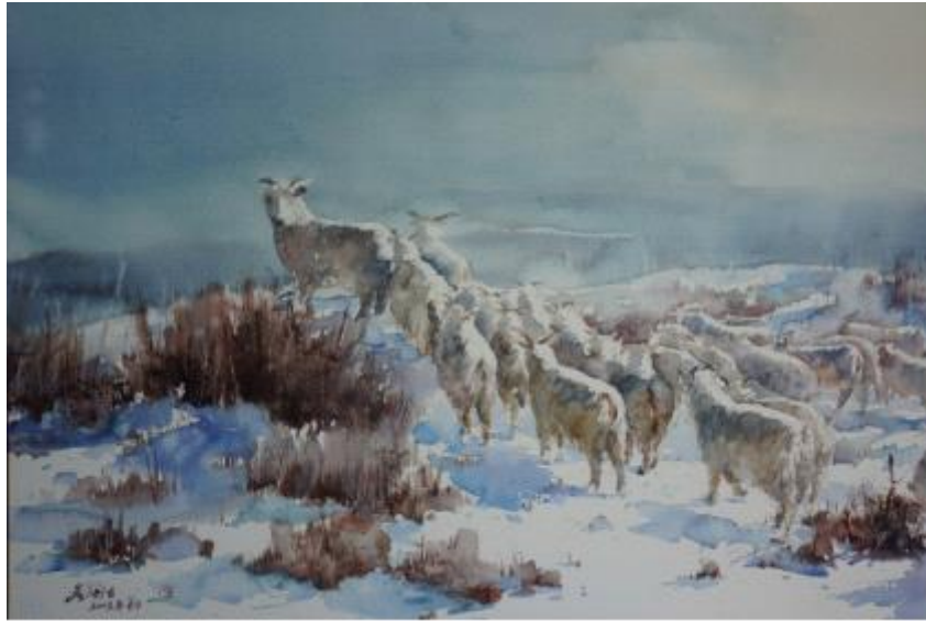
【Plateau】 57cm*77cm Aquarell 2013